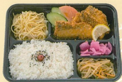
日替り 日替わり弁当 600円