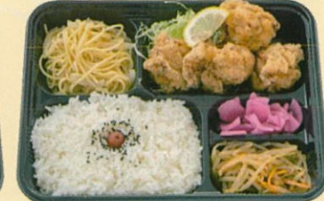
鯛だし唐揚げ弁当 600円