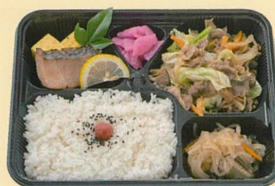
日替り 幕の内弁当 600円

●お弁当お買い上げのお客様は、 鯛焼き1個からの注文もOK! ●鯛焼きのみのご注文は、 5個以上のご注文で配達します。