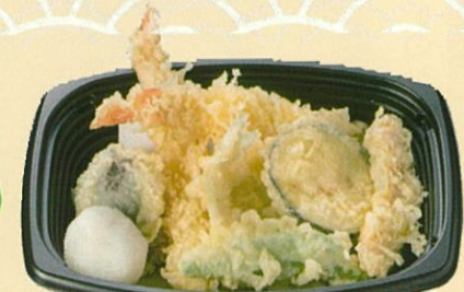
エビと野菜の天ぷら 600円