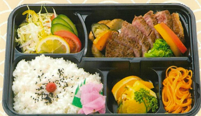
長崎和牛ステーキ弁当 2,600円