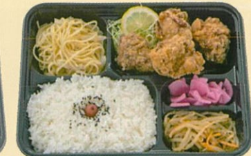
しょうゆ唐揚げ弁当 600円