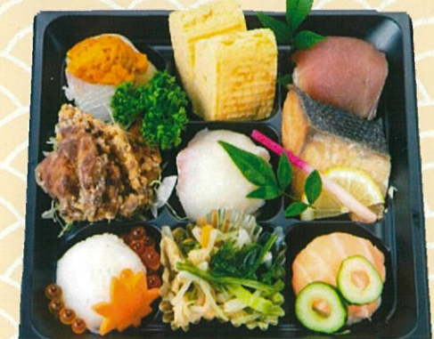
てまり寿司弁当 1,000円