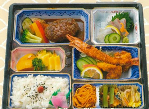
ちよっぴり贅沢幕の内 2,200円