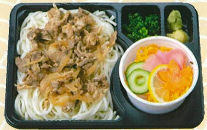
冷し生姜焼うどん 600円