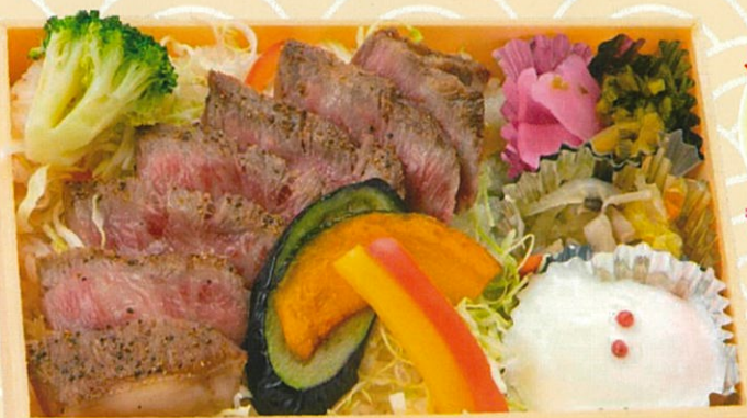
長崎和牛ステーキ重 2,500円