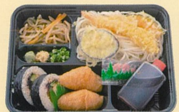
五島うどん助六弁当 650円