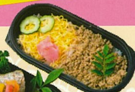
【特別メニュー】 幕の内二段重/ 彩り幕の内弁当 600円