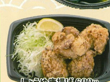
しょうゆ唐揚げ 600円 鯛だし唐揚げ 600円