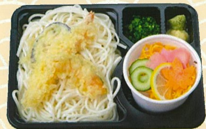
冷し天ぷらうどん 600円